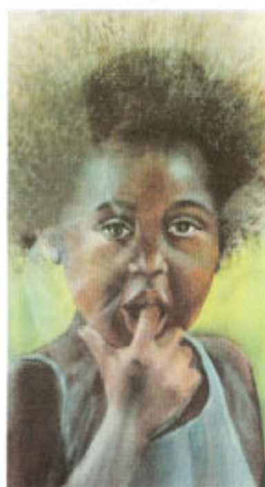
Autor: Deisy Varela Título: Y ahora qué