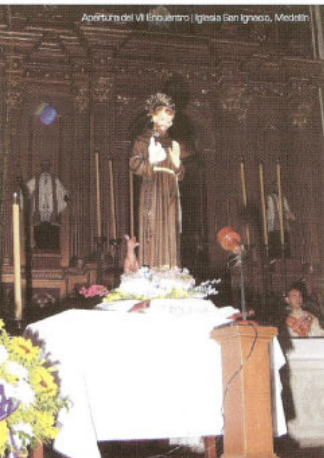
Apertura del VII Encuentro | Iglesia San Ignacio, Medellín