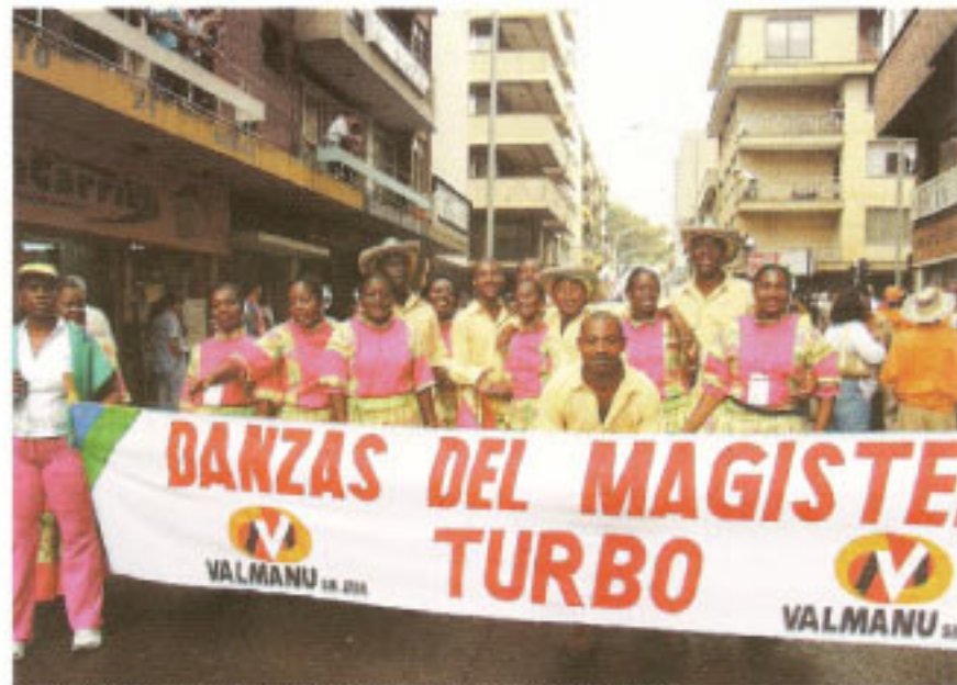
Desfile de Comparsas | Danzas del Magisterio de Turbo, Centro de Medellín

El quince de octubre, declarado día clásico del Séptimo Encuentro de la identidad y la Diversidad Cultural, se realizó una misa especial con ritual afro en el teatro Luis Felipe Vélez de ADIDA y posteriormente en el mismo lugar, se dieron cita las diferentes delegaciones de dentro y fuera del departamento de Antioquia, para deleitar al público asistente con una muestra cultural, llena de tradición, color, alegría y mucho profesionalismo. Desde las danzas tradicionales hasta ritmos más modernos, dieron cuenta de la gran diversidad de nuestro país y acercaron a los asistentes a esa identidad que se estaba buscando.