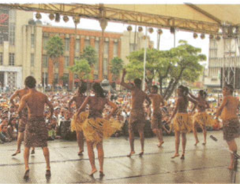
Academia de danza Etnia Villegas del Atlántico, Tarima Centro de Medellín