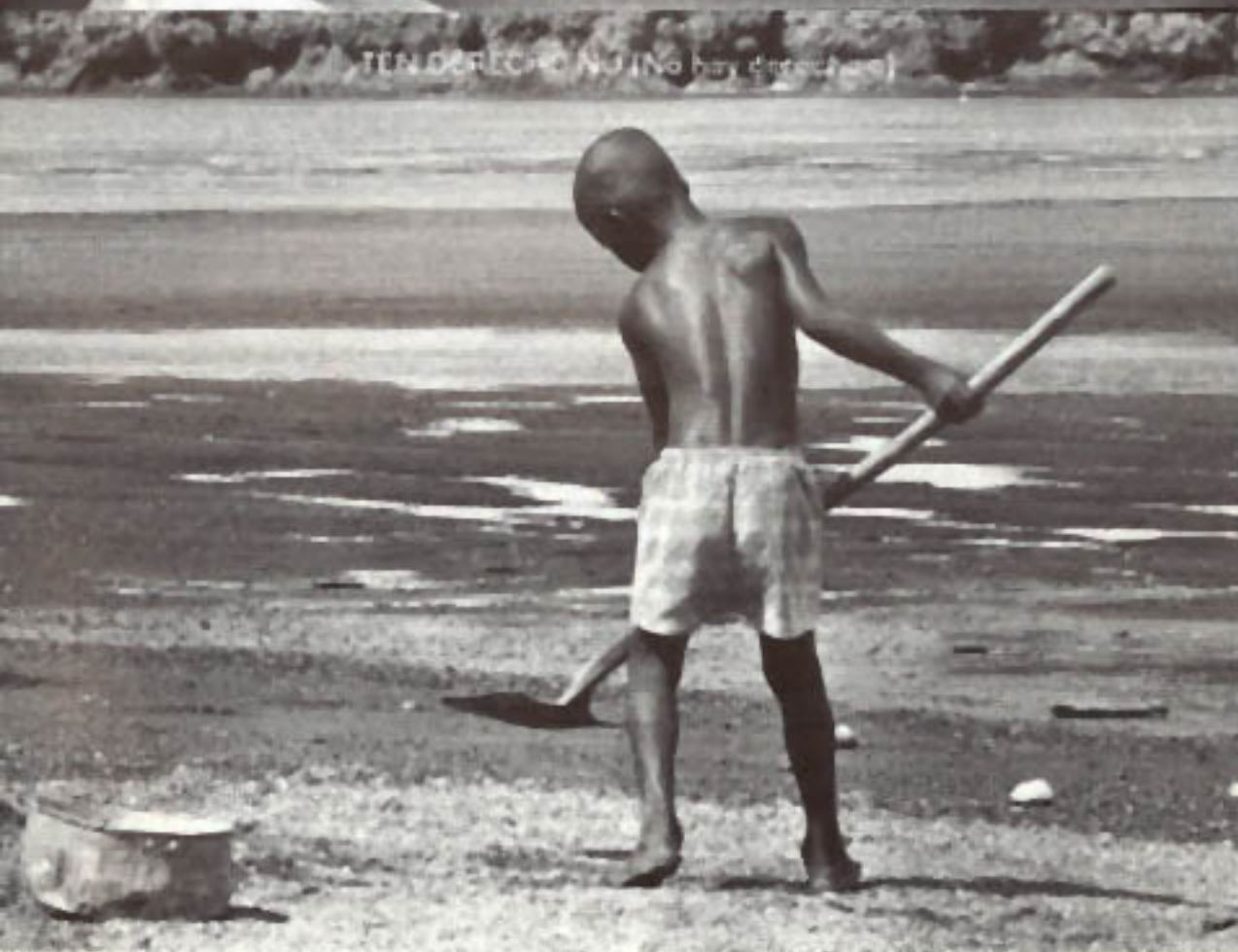
TEN OZ RECHO NUI (No hay dirección)

Los nombres de las obras están en BANTÚ CRIOLLO , lengua heredada desde la esclavización, que en la actualidad se habla en San Basilio de Palenque, Bolívar, Colombia.