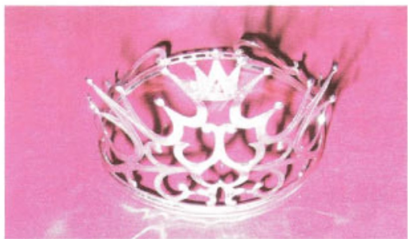
Corona del Reinado Diosa de Ébano