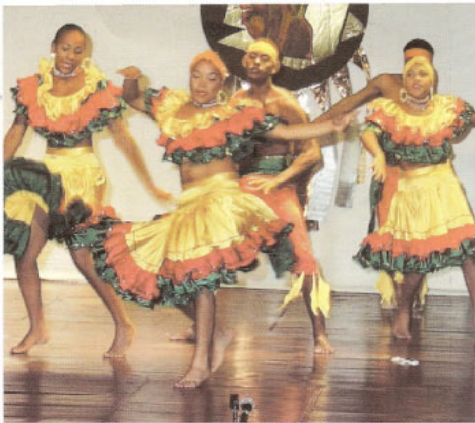
Grupo Juventud Caribe de Cartagena, Teatro Luis Felipe Vélez