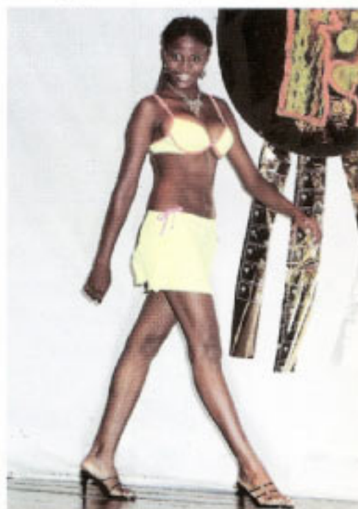
Desfile en traje de baño, Teatro Luis Felipe Vélez