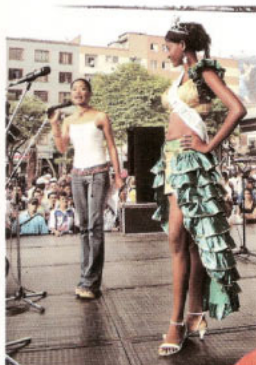
Presentación en traje de fantasía, Plazuela Botero, Medellín