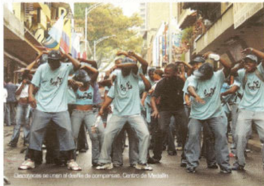
Comparsas se crean el desfile de comparsas, Centro de Medellín