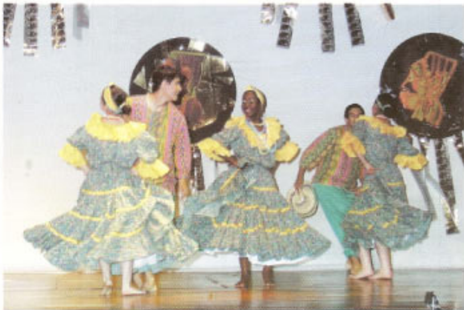
Grupo de danza de la Universidad de la Salle de Bogotá, Presentación en el Día Clásico VI Encuentro de la Identidad.