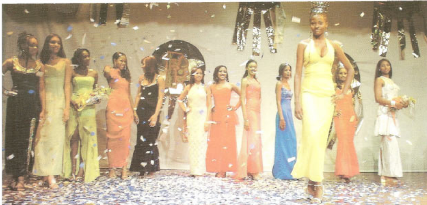
Elección Diosa de Ébano, 2005-2006