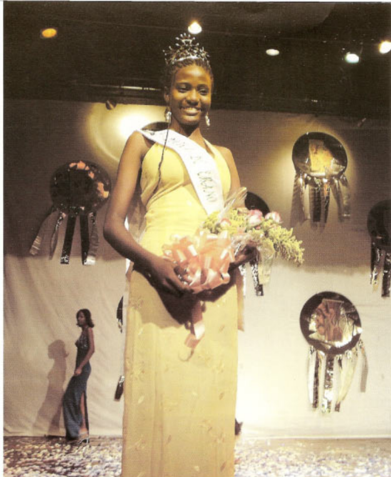
Noche de gala, Teatro Luis Felipe Vélez