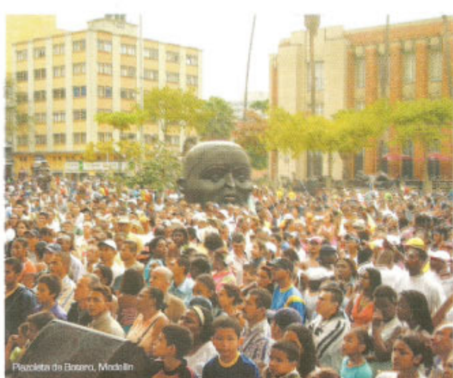
Plazoleta de Botero, Medellín

En la plazoleta de las esculturas, un lleno sin precedentes. El cierre del Séptimo Encuentro de la Identidad y la Diversidad Cultural, fue el espacio de mayor confluencia entre todas las actividades y quizá también el más impactante para la ciudadanía de Medellín; desde su creación, la Plazoleta de las Esculturas no había albergado tantas personas en torno a la cultura; en ella, se conjugaron las artes plásticas del maestro Botero, con las artes escénicas de las delegaciones que participaron en el encuentro, así como con las expresiones artísticas musicales. Y qué más arte que toda una etnia diciéndole a Medellín de su existencia y su valor cultural. La fiesta parecía no querer acabar, tuvo la noche que bañar los cuerpos, para que exhaustos de baile y disfrute, dieran fin a este día de celebraciones.