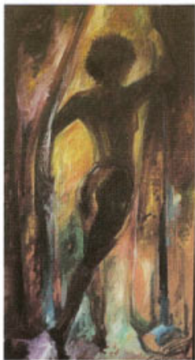
Autor: Clara Inés Pérez Título: Figura femenina