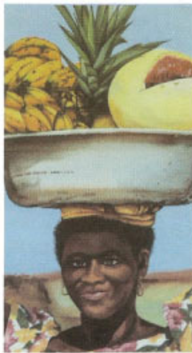
Autor: Klara Torres Título: Más caribeña

Exposición de artes Inspiración Afro Un selecto grupo de artistas antioqueños se dio cita en el Palacio de la Cultura Rafael Uribe Uribe, para rendir tributo a la Étnia negra con sus obras de arte, durante todo un mes se expusieron pinturas en diferentes técnicas, pero que tenían en común la Inspiración Afro .