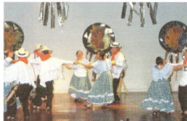
Grupo Tradición, Vereda San Andrés de Girardota