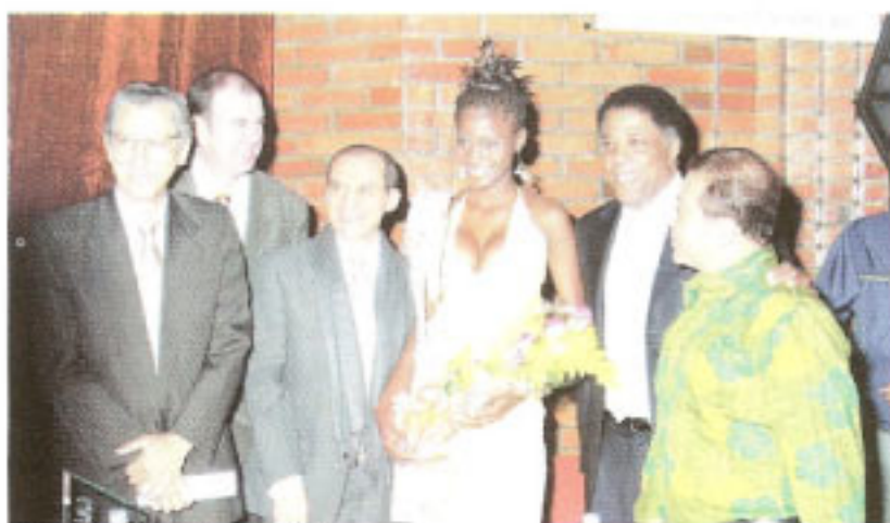
Jurados del Reinado Diosa de Ébano